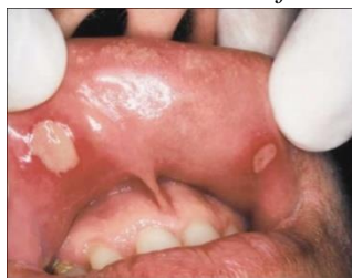
Gambar 2 Klinis RAS mayor pada mukosa labial superior. 3

RAS mayor sering disebut dengan Sutton's disease atau peradenitis mucosa necrotica recurrens . Lesi ini memiliki tampilan yang mirip dengan RAS minor; namun, diameternya lebih dari 10 mm, lebih dalam, sering menimbulkan parut, dan dapat bertahan selama berminggu-minggu hingga berbulan-bulan dan lebih sering terjadi pada bagian palatum, sering ditemukan pada pasien terinfeksi human immunodeficiency virus . 2,3,12