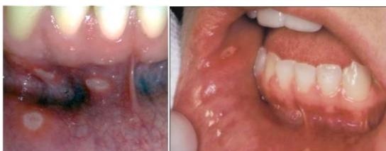
Gambar 1 Klinis RAS minor pada gingiva dan mukosa bukolabial. 3

Minor merupakan jenis RAS yang paling umum terjadi dengan prevalensi sekitar 85%. RAS minor ini biasanya terjadi pada mukosa rongga mulut yang tidak berkeratin, yaitu mukosa labial dan bukal, dasar mulut dan permukaan ventral atau lateral lidah, dan biasanya terjadi di bagian anterior mulut, yaitu bibir atau mukosa bukal anterior. 2,3