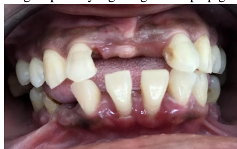
Gambar 1 Foto intraoral awal. Frenulum tampak tinggi dan terdapat pigmentasi anterior

Pasien wanita usia 37 tahun datang ke RSGM Unhas dengan keluhan kehilangan gigi anterior rahang atas. Pemeriksaan subjektif pasien tidak menderita kelainan sistemik dan alergi. Riwayat Kesehatan gigi, pasien merupakan rujukan dari Bagian Prostodontia. Pada pemeriksaan intraoral nampak kehilangan gigi 11 dan 21, perlekatan frenulum tinggi di daerah interdental gigi insisivus sentral atas dan terdapat hiperpigmentasi gingiva pada gigi anterior maksila dan mandibula. Hiperpigmentasi yang terjadi mungkin disebabkan oleh faktor keturunan yang diketahui salah satu orang tua pasien yang mengalami hiperpigmentasi